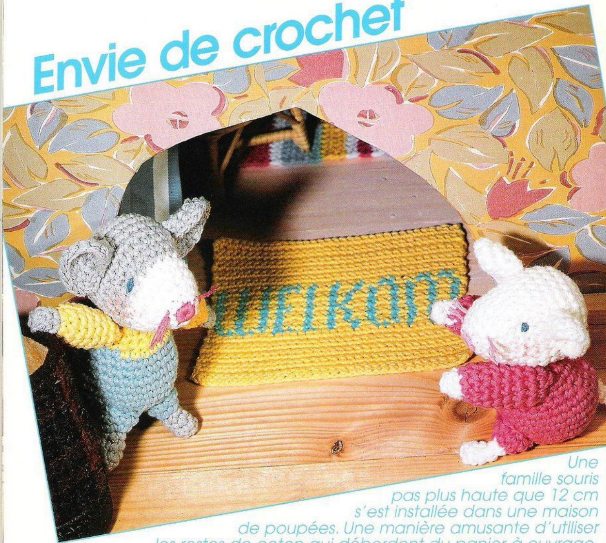
Une famille souris pas plus haute que 12 cm s'est installée dans une maison de poupées. Une manière amusante d'utiliser les restes de coton qui débordent du panier à ouvrage.